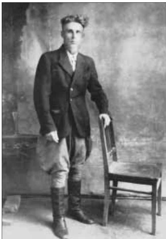
Скакал хорошо. За полсезона выиграл 1-е место 21 раз. Мне — 19,5 лет. Сальск. 04.09.1947