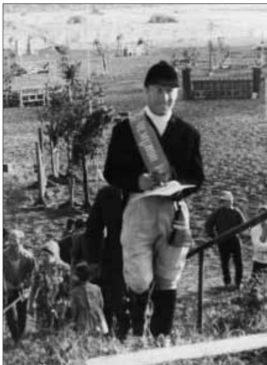
Я — чемпион РСФСР по конкуру. Московская конноспортивная школа ДСО «Спартак». 1956 г.