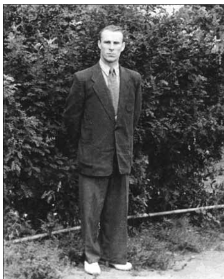
Сразу после Румынии. Чемпионат России. Почти все повыигрывал. Конкур, пробеги и другие призы. Нальчик. 1957 г.

Как-то раз устроили первомайские соревнования в Новочеркасске. У меня в команде ДОСААФ были и мальчишки, и девочки. Участвовали несколько команд, и среди них — команда СКВО (Северо-Кавказского военного округа). И мы этих вояк победили. Перед награждением командующий уехал, ворота закрыли, чтоб публика не видела, кто выиграл. Военных начальство отчехвостило. Как же так: какой-то мальчишка обскакал офицеров? После этой победы меня пригласили в команду СКВО. Так я стал военным, причем выступал я от них в конкуре.