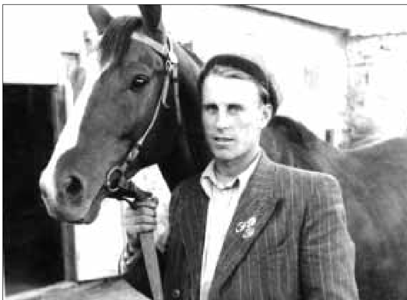
Мой Талант. Много успехов он мне привез. 1954 г.