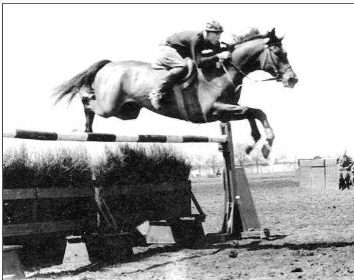
Барьерные скачки. Чемпионат России. Конь Мятёж. 1956 г.