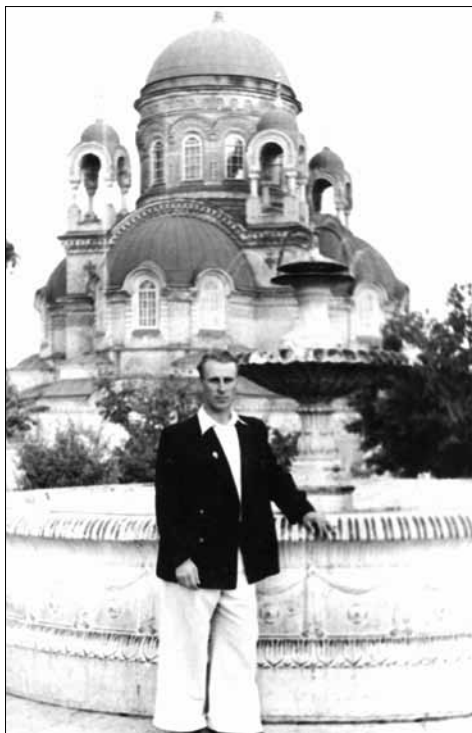
Сразу после армии. Новочеркасск. 1954 г.