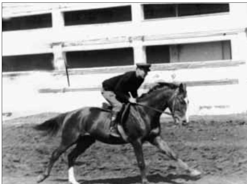
Новочеркасск, ипподром. Жеребец Талант