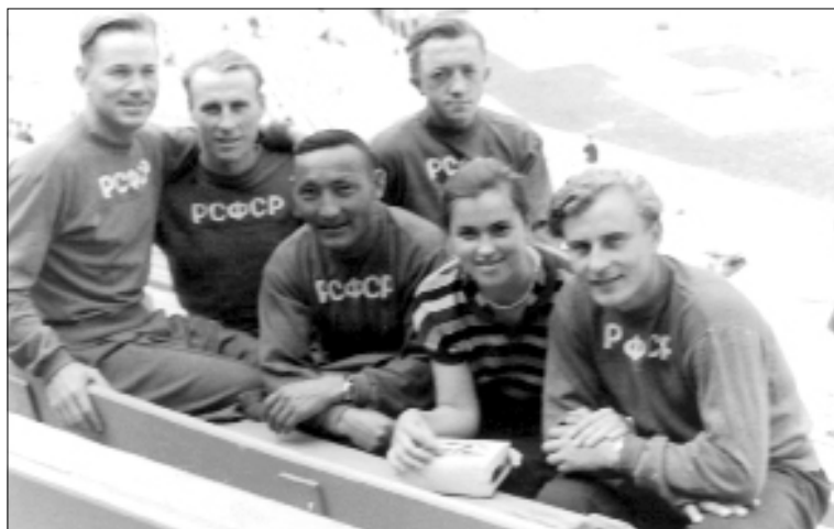
Сборная РСФСР по конюству. Я — второй слева. Москва, стадион «Лужники». 1956 г.

— Конечно, в частности, когда надо было готовить лошадь к барьерной скачке. Я же знал, как делать тренинг, сколько рысить, когда резвую делать. А другие из троеборья возьмут лошадь и едут, это ж совсем другое дело. И, что немаловажно, скачки помогли не бояться резвости.