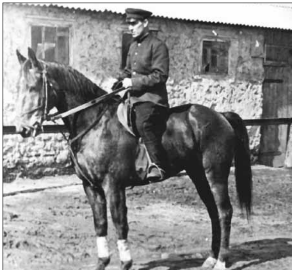
Я на Сатрапе. Новочеркасск. Я его оставил в Новочеркасске, а сам уехал в Ленинград. Потом он был участником трех олимпиад. Тракен. Таких — мало. Как увидит препятствие — уши, как у зайца, и не отвернуть. Любил прыгать. Был куплен с бойни у солдата за пол-литра