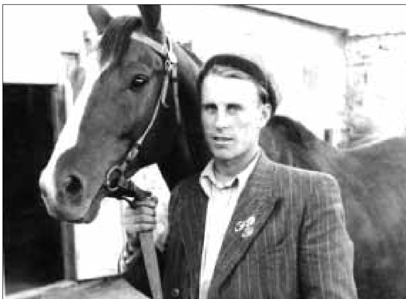
Мой Талант. Много успехов он мне привез. 1954 г.