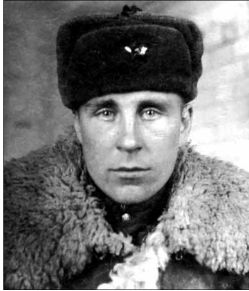
Погранвойска. Гродно, Белоруссия. 1950 г.

Продав я гармонику и купил баян. Папа помог — продал корову за 800 рублей и еще добавил денег.