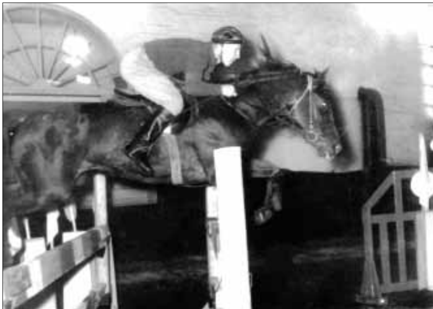
Я — старший тренер по конкуру города Ленинграда. Мне 30 лет. Посадка — жокейская