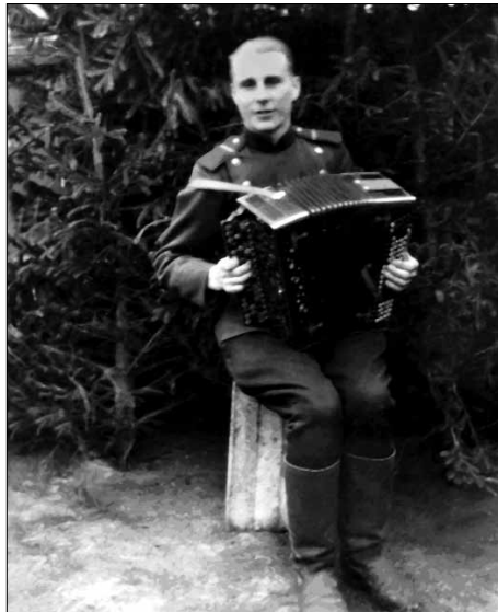
Гармошка — моя подруга и любовь на всю жизнь. Служба в армии. 09.02.1951

Папа беспокоился — ждали-ждали младшего сына, и вот я вернулся, а работать мне негде. Хотел пойти сварщиком, но мне задали несколько вопросов по математике... И не взяли.