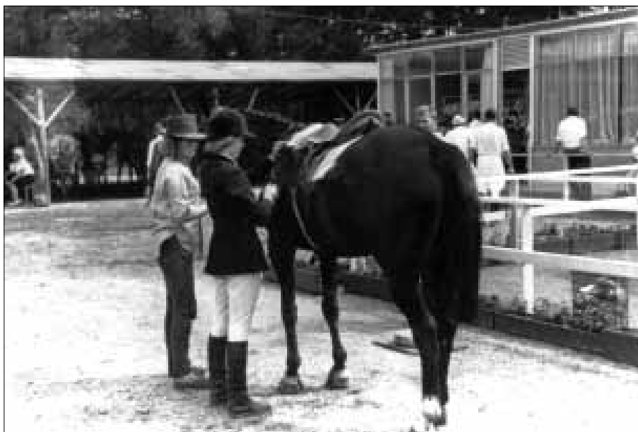
Кобыла из Дании. При росте 148 см прыгала до 215 см. Я сам это видел. Была участницей Олимпийских игр в Мехико

— Среди ваших учеников кого вы можете назвать?