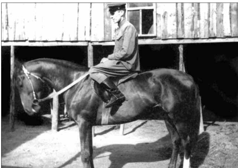
Жеребец Талант. Победитель многих барьерных скачек и стиль-чезов. Рекордист ДОСААФ СССР на 3000 м, 3 мин. 24 сек. Вот такая посадка жокейская. 1954 г.