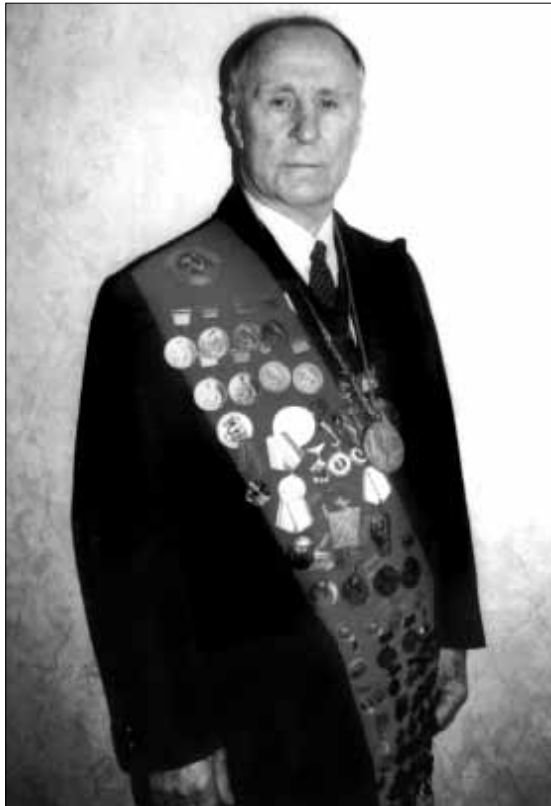
Всего 92 медали