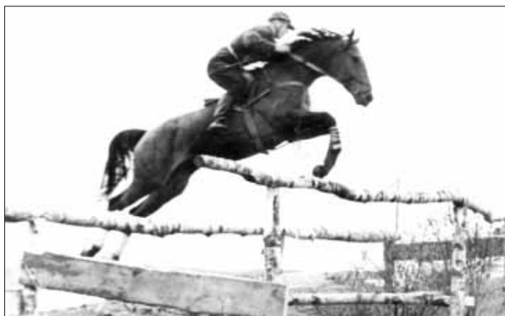
Я прыгаю на Сатране в черте города, зимой. Это шоссе «Кавказ — Москва», на выезде из города, подъем на мост. Я впрыгивал на шоссе, делал два темпа — и прыгал вниз с шоссе. На шоссе стоял пацан и кричал водителям: «Стоп, стоп», — пока всадник не проедет. Рядом — речка. Вот такая была троеборная трасса

Как-то раз устроили первомайские соревнования в Новочеркасске. У меня в команде ДОСААФ были и мальчишки, и девочки. Участвовали несколько команд, и среди них — команда СКВО (Северо-Кавказского военного округа). И мы этих вояк победили. Перед награждением командующий уехал, ворота закрыли, чтоб публика не видела, кто выиграл. Военных начальство отчехвостило. Как же так: какой-то мальчишка обскакал офицеров? После этой победы меня пригласили в команду СКВО. Так я стал военным, причем выступал я от них в конкуре.